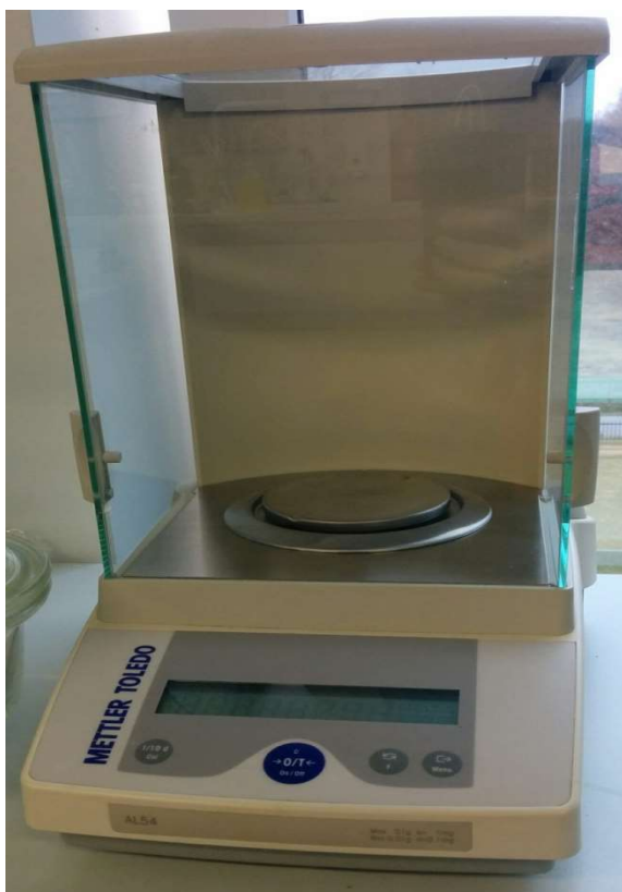
Joonis 2. Analüütiline kaal.

Illustreerivat materjali (joonis, tabel, tsitaat vm) ei esitata järjest ilma vahepealse tekstita.