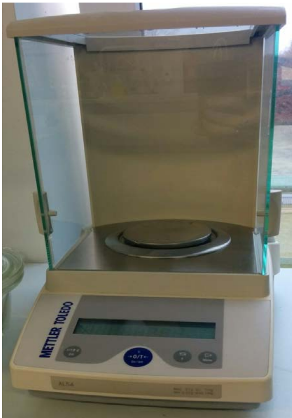
Joonis 2. Analüütiline kaal.

Illustreerivat materjali (joonis, tabel, tsitaat vm) ei esitata ilma vahepealse tekstita järjest.